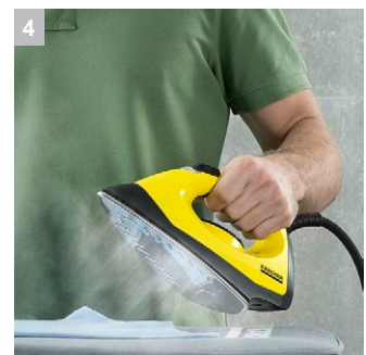
4 Улучшенное качество глажки (только в SC 4 EasyFix Iron)