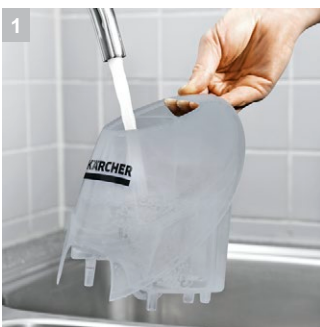
1 Съемный бачок для доливки воды