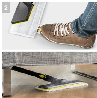
2 Насадка для пола EasyFix с шарниром и удобным креплением салфетки липучкой